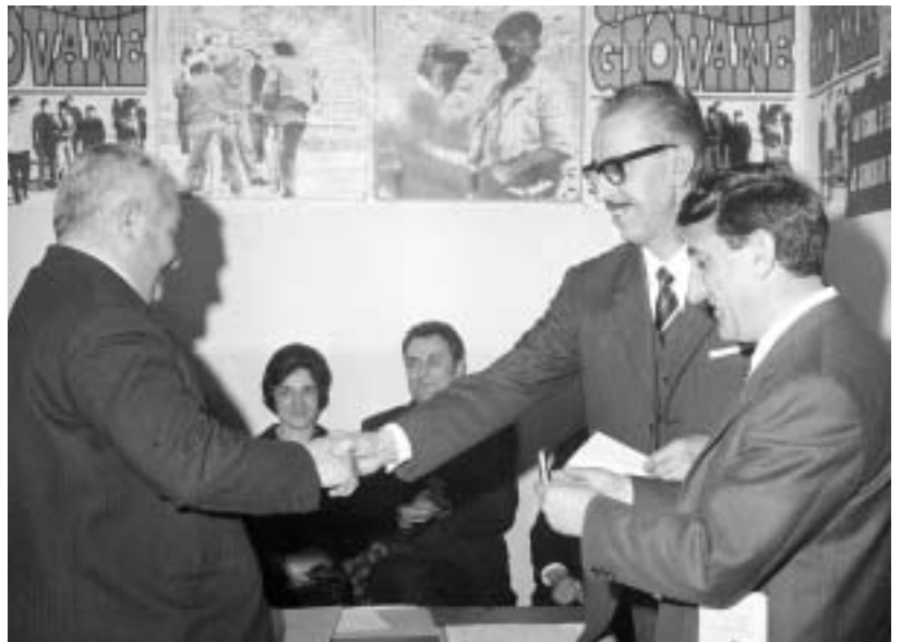
Roma - 12/09/48 Convegno Nazionale Ottantesimo Gioventù Italiana di Azione Cattolica

c'era la chiamata al servizio di leva, consigliava anche su argomenti tecnici circa le pensioni di anzianità e di invalidità (che molti hanno ottenuto grazie al suo interessamento). Riassumendo poteva essere considerato un “consulente”, ma era soprattutto un amico, un confidente. Ha avuto ruoli importanti: militante nella Democrazia Cristiana, nella Gioventù Italiana di Azione Cattolica e Delegato Acli, insomma era una persona veramente poliedrica, in un mondo in cui il contatto umano e l'impegno erano ancora indispensabili. L'Angelino che ancora abbiamo nella memoria che “sgasava” a bordo del suo Malaguti azzurro e bianco, non è meno nobile ed importante di Mario Jimenez, protagonista de “Il Postino di Neruda” di Skermeta: entrambi a loro modo, hanno saputo entrare nel cuore di coloro che ogni giorno aspettavano il loro arrivo. Accantoniamo stampante e video, riprendiamo ancora carta e penna e scriviamoci.