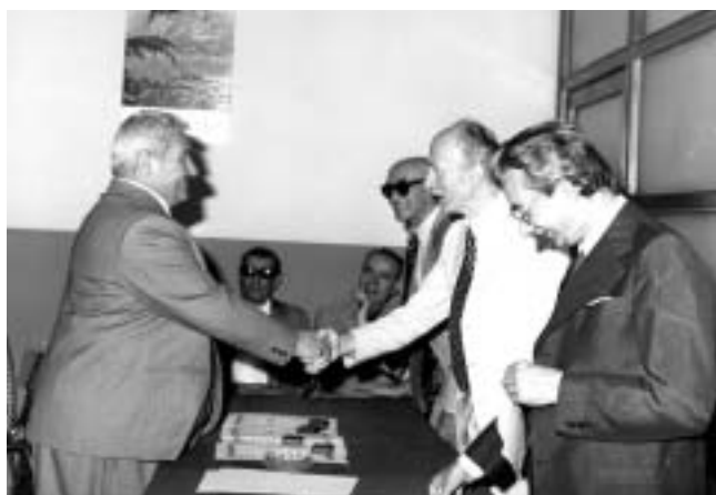
Consegna Attestato - Como 29/06/76